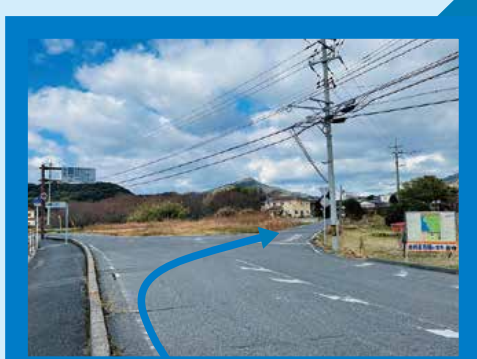
右折①: 吉母公民館手前を右折。「本州最西端のまち吉母」の看板が目印。