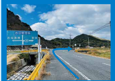
右折②: 白破線に従い県道 245 号へ右折。直進すると本州最西端の地毘沙ノ鼻に至る。