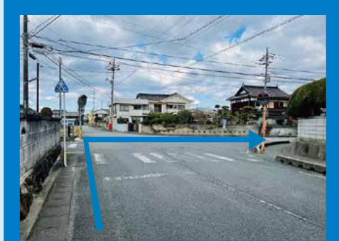
右折③: 小串警察署室津駐在所前を右折。